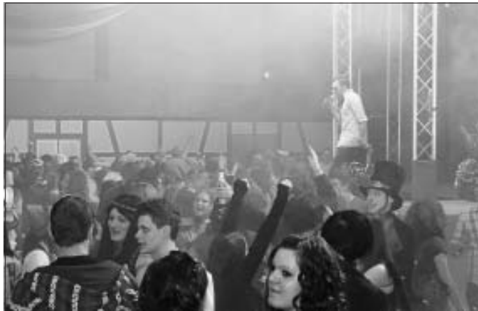
Am vergangenen Wochenende zog es zahlreiche Narren und Partyfreunde in die Gemeindehalle Stammheim.