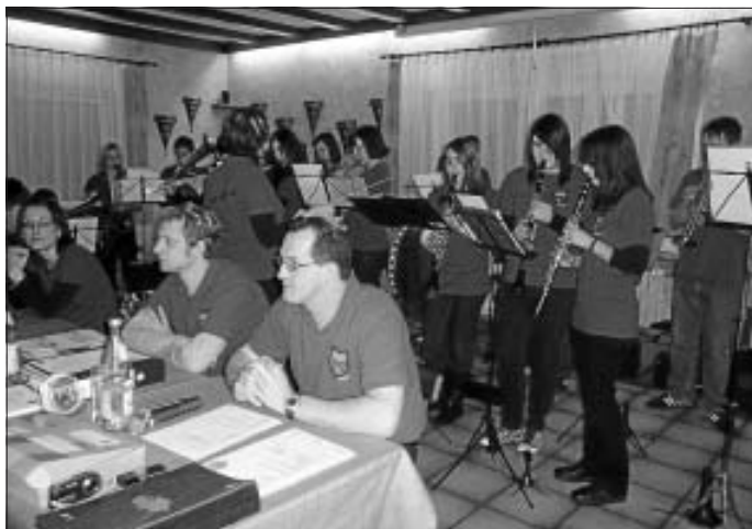
Die Jugendkapelle eröffnete die Versammlung mit einem Marsch.