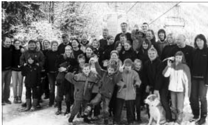
Die 40 Teilnehmer der Skiausfahrt 2010