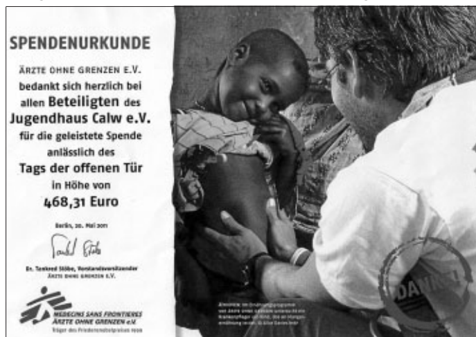
Spendenurkunde von "Ärzte ohne Grenzen e.V."

Anlässlich der schweren Katastrophenereignisse in Japan veranstaltete das Stadtjugendreferat am 16. April einen Tag der offenen Tür mit Benefiz-Konzert im Jugendhaus. Die Bands "The Cue", "The Frägomo-Experience" und "The Mofos" boten feinsten Rock, Alternative und Happy-Metal. Der Reinerlös des gesamten Tages in Höhe von 468,31 Euro wurde dem Verein "Ärzte ohne Grenzen e.V." für seine Aktivitäten in Japan gespendet. Mit der Veröffentlichung der Spendenurkunde möchten wir uns noch einmal ganz herzlich bei allen Besuchern und Beteiligten bedanken!