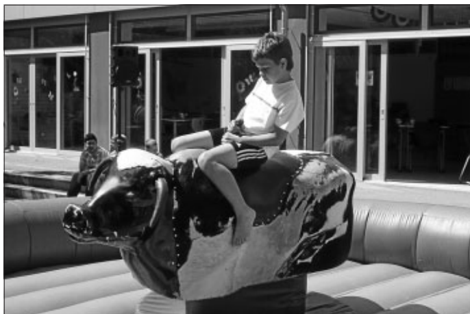
America-feeling - der Ritt auf dem "Wilden Büffel"

Zum Abschluss des Amerika-Projekts der Realschule Calw präsentierten am vergangenen Freitag alle Mitwirkenden in der Calwer Aula das Broadway-Musical "Big River" nach Roger Miller. Die von Mark Twain geschriebenen Abenteuer um Huckleberry Finn und Tom Sawyer begeistern noch nach über 100 Jahren die Jugend. Auch das am folgenden Tag stattfindende Schulfest war dem Thema "Amerika" gewidmet.