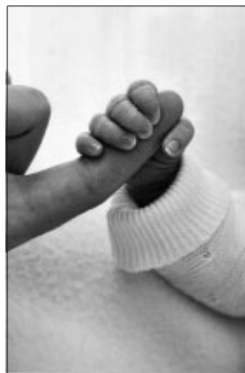
Mit Kraft ins Leben - Kliniken Calw

Die geburtshilfliche Abteilung der Kliniken Calw lädt werdende Eltern am Donnerstag, den 18. August, um 19.30 Uhr zu einem Informationsabend im Gemeinschaftsraum ein. Themen sind u. a. Schwangerschaft, Geburtsvorbereitung, Geburt, Wochenbett, Stillen, Neugeborenenpflege und Nachbetreuung. Zur Sprache werden auch alternative Methoden wie Homöopathie und Aromatherapie kommen. Als Gesprächspartner stehen Hebammen, Kinderkrankenschwestern und Ärzte der Geburtshilfe zur Verfügung. Neben den allgemeinen Informationen werden auch die Angebote der Wochenstation, des Kreißsaals und des Kinderzimmers vorgestellt. Geplant ist zudem eine