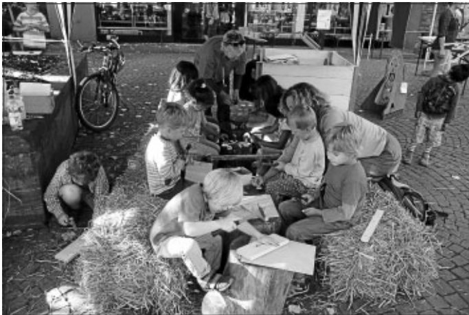
Die Kinder waren mit Eifer bei der Arbeit

Bei allerschönstem Herbstwetter fanden am letzten Wochenende die Gartentage in Calw statt. Mit dabei war der Waldkindergarten mit einer Bastelstation. Es wurde fleißig gehämmert, gesägt, gebohrt und geleimt. Die Kunstwerke reichten vom Schwert, über jede Art von Fahrzeugen bis hin zu großen und kleinen Häuschen, welche die Kinder mit nach Hause nahmen. War schön, dass ihr uns so zahlreich besucht habt.