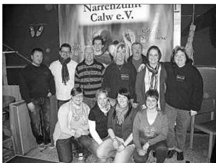
Die neue Vorstandschaft

Wir gönnen uns eine Verschnaufpause. Ab dem 4. April sind wir wieder da. Probe montags und donnerstags von 19 Uhr bis 21 Uhr im Vereinsheim.