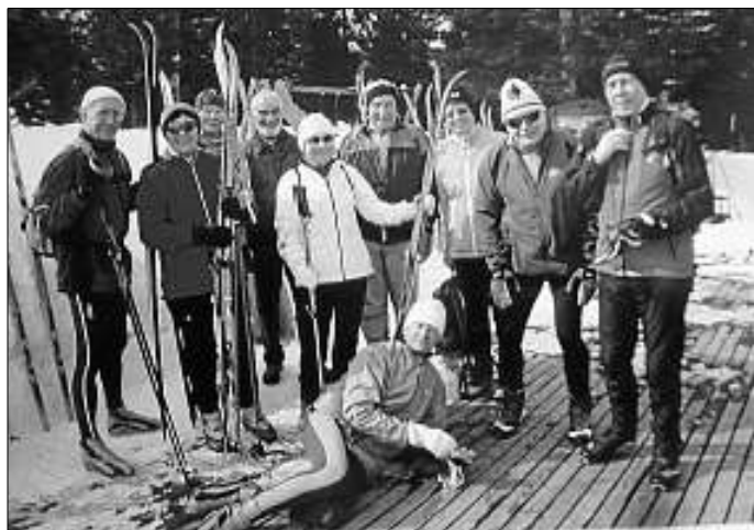
Einige Teilnehmer vor dem Hotel Laurin

Die Skizunft war in Südtirol auf herrlichen Loipen unterwegs. Am ersten Tag hieß es für die Langläufer sich einzulaufen. Es ging ins Höllensteintal, vorbei an Toblacher- und Dürrensee mit schönem Blick auf die drei Zinnen und den Monte Cristallo. Es ging bis auf fast 1600 m Höhe zum Gemärk und nach Cortina d'Ampezzo. Ziel des zweiten Tages war die Biathlonstrecke in Antholz mit dem zugefrorenen Antholzer See. Man durfte sich hier einmal an den Schießplätzen im Liegen probieren, mit Erfolg bei vier bis fünf Treffern ohne nachzuladen. Am dritten Sonntag ging es nach Sexten und ins Fischleintal zur Talschlusshütte. Von hier aus hatte man einen sehr schönen Blick auf die so genannte Sextener Sonnenuhr - den Elfer-, Zwölfer- und den Einerkogel. Wenn über diesen Gipfeln die Sonne stand wussten die Sextener Bauern dass nun Mittag ist. Auch einige alpine Skiläufer waren bei der Ausfahrt wieder dabei. Bei idealen Schneebedingungen carvten sie an der Rotwand und am Helm. Die Wandergruppe fand jeden Tag neue Wege und traf sich öfter mit den Langläufern in einer der gemütlichen Hütten. Mit einem Bummel in Toblach, einem Besuch des Soldatenfriedhofs und einem "Einkehrschwung" am Toblacher See gingen vier schöne Tage in dieser wunderbaren Gegend zu Ende.