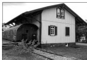
Die Donnerbüchse am Güterschuppen Althengstett

stärkere Gruppe hatte von hier aus ca. 85 km mit einigen Steigungen zu bewältigen über Schömberg, Alpirsbach, Schiltach, Hausach und Wolfach nach Gengenbach, dem Zielort. Die zweite Gruppe begann in Alpirsbach auf der Strecke. Von hier aus ging es fast immer eben oder bergab bis Gengenbach. Auf der Fahrt durch die herrliche Landschaft fast quer durch den Schwarzwald kam sogar die Sonne heraus. Die Strecke verlief auch durch einige historische Städte, deren Stadtkerne man zu Fuß erkundete und nicht vergaß, in einem der romantischen Straßencafés einzukehren. Nachdem die Räder wieder verstaubt waren und man über den alten Marktplatz gebummelt war, trafen sich dann alle zu einem Abschiedsessen. Es war eine rundum gelungene Kooperation.