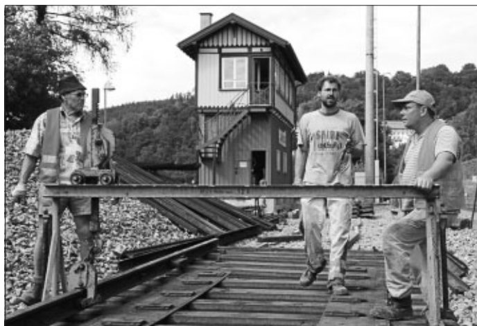
Vereinsmitglieder beim Verlegen der ersten Schiene auf den ca. 100 Jahre alten Stahlschwellen.

Wie an dieser Stelle berichtet, sind eine nicht mehr benötigte Weiche und ein Prellbock vom alten Bahnhof Althengstett in Einzelteilen auf das Gelände des Museumsstellwerks in Calw transportiert worden. Am vergangenen Samstag haben Vereinsmitglieder nun damit begonnen, die Weiche an ihrem neuen Bestimmungsort zu montieren.