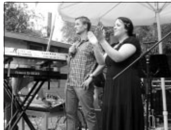
Eröffnungsfest der neuen Begegnungsstätte der Lebenshilfe Calw e.V. im alten Schulhaus in Neuhengstett

Nach einem sehr ereignisreichen SWR-Wochenende und dem fleißigen Einsatz der Feuerwehr Horb-Dettensee ist die Baustelle der Lebenshilfe Calw e.V. im alten Schulhaus in Neuhengstett weitestgehend abgeschlossen.