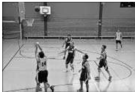
Das entscheidende Spiel um die Aufstiegsrunde am kommenden Sonntag in der Badstraßenhalle, 16 Uhr

14.50 Uhr gJE 2: SV Aidlingen - SG HCL 2