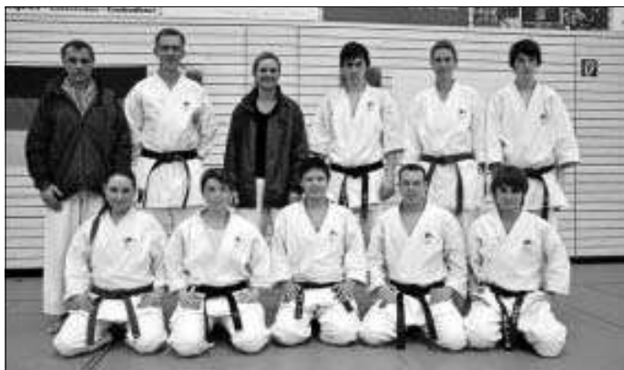
Calwer Karatekas beim Bundestrainer zu Gast

Am 8. und 9. Juli dürfen wir ihn bei uns in Calw, Gemeindehalle Stammheim, wieder begrüßen.