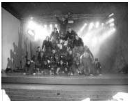
Rückblick : Der Hexen- und Guggeball war dieses Jahr wieder ein toller Erfolg.

Probe montags und donnerstags von 19 Uhr bis 21 Uhr im Vereinsheim.