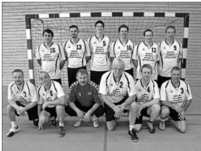
Die 3. Männermannschaft der SG HCL mit neuen Trikots.