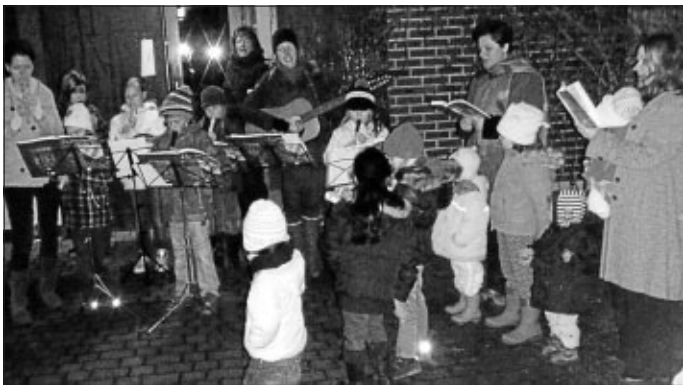
Die Flötengruppe und die Kinderkirche Wimberg gestalteten vergangenen Montag den Lebendigen Adventskalender am Gemeindehaus