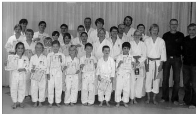
Mit neuem Karate-Gürtel ins neue Jahr