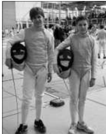
Die 2 Erfolgreichen

Fechter einziehen. Hier gewann er zunächst drei Gefechte.