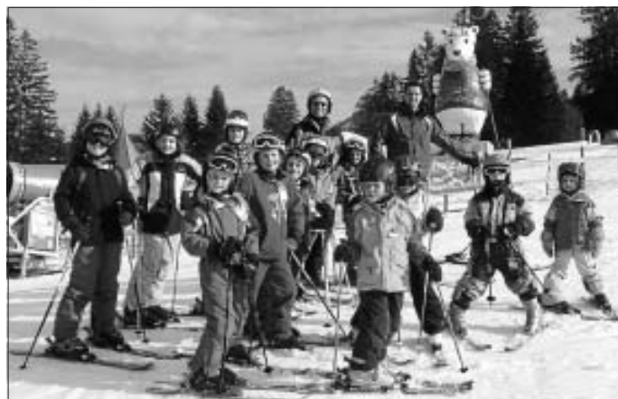
Die Skizwerges am Hang in Jungholz

Informationen hierzu gibt es unter www.skizunft-calw.de . Das Skischulteam bedankt sich bei allen Teilnehmern und ihrem gesamten Team für das entgegengebrachte Vertrauen und die tatkräftige Unterstützung.