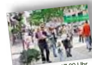
03.04., 12.00 bis 17.00 Uhr, Spiel & Spaß in Calw - verkaufsoffener Sonntag, Innenstadt

Halbstündiges Orgelkonzert zur Marktzeit.