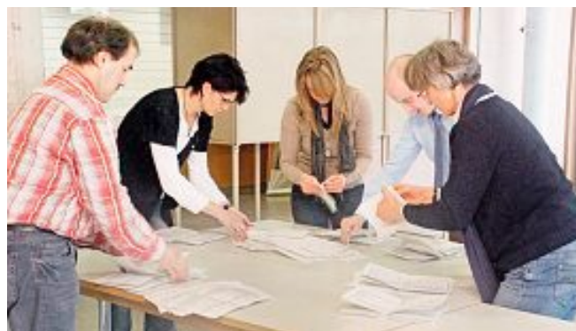
In den 19 Calwer Wahlbezirken (davon zwei Briefwahlbezirke) waren insgesamt 125 Wahlhelfer im Einsatz