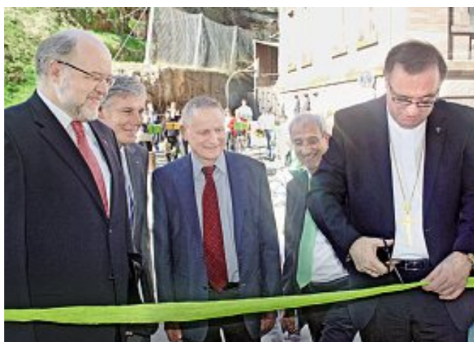
Landesbischof July durchschneidet das Band zum Haus der Kirche und gibt dieses für die Besucher frei

Ab sofort sind dort zwölf Dienststellen von Kirche und Diakonie sowie vier Standorte unter einem Dach vereint. Ein Wunsch, den Landesbischof July zu Beginn seiner Amtszeit in Stuttgart auch hatte. Leider stieß seine Idee auf wenig Gegenliebe. „Heute würde ich nicht mehr so schnell aufgeben“, sagte er. Einer der nicht aufgegeben hat auf dem Weg hin zum Haus der Kirche, ist Dekan Erich Hart-