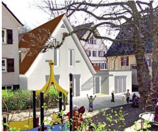
Planskizze: Büro weinbrenner.single.arabzadeh

Es wurden die bisherigen Planungen von Herrn Hihn, Architekt, vorgestellt und bespro-