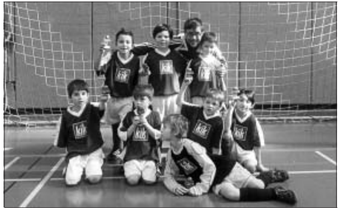
Unsere F2 beim Benefizturnier "Kinder spielen für Kinder" in Mairchingen.