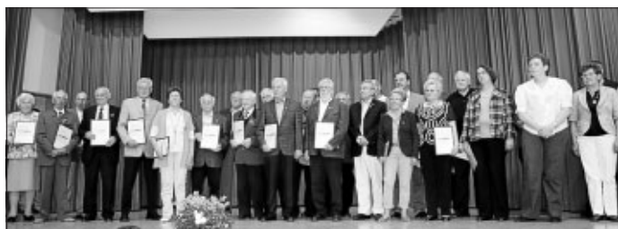
Alle Geehrten beim Chorverbandstag