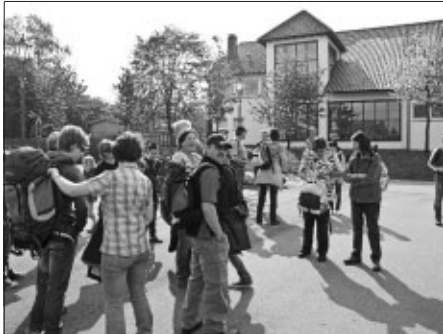
Die Rucksäcke sind gepackt: Los geht es in den Mai!

Bei wunderbarem Sonnenschein starteten wir Sänger und Familien zu einer schönen Wanderung zum Adlerhorst bei Stammheim. Dort in geselliger Runde am Grill, bei Spaß und Spiel stärkten wir uns und die Sportlichsten schafften auch den Weg zu Fuß zurück. Die Anderen haben sich das für die Maiwanderung 2012 natürlich auch vorgenommen.