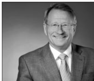
Wolfgang Drexler, MdL

Nachdem der ursprünglich vorgesehene Termin wegen den Koalitionsverhandlungen verschoben werden musste, kommt Wolfgang Drexler, MdL und Vizepräsident des Baden-Württembergischen Landtages nun am Freitag, 27. Mai zum Männerforum nach Heumaden. Er wird zu Stuttgart 21 und der Neubaustrecke Stuttgart-Ulm sprechen. Drexler war bis September 2010 Sprecher des Bahnprojekts Stuttgart-Ulm.