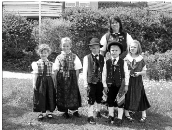
Die Kinder der Trachtengruppe vor dem Auftritt

Am vergangenen Sonntag stellte die Trachtengruppe Altburg wie im vergangenen Jahr ihre Trachten und Tänze den Bewohnern und Besuchern beim Tanz der Nationen im Altenheim "Haus auf dem Wimberg" vor. Nach der Einleitung durch die Jugendkapelle des Musikvereins Altburg und der Begrüßung waren wir auch schon dran. Mit den Tänzen Sternpolka, Lauterbacher, Mühlrad, Schwäbische Tanzfolge und Insterburger Viergespann konnten die Erwachsenen das Publikum begeistern. Auch die Kinder trugen mit der Trampelpolka und dem Rädeltanz zur Unterhaltung der Zuschauer bei. Mit dem Klapptanz bewiesen wir auch, dass Groß und Klein auch zusammen tanzen können. Auch in diesem Jahr war wieder die portugiesische Folkloregruppe aus Calw dabei, sowie eine Hip-Hop-Gruppe mit Mitgliedern aus verschiedenen Nationen. Den Abschluss machte wieder die Jugendkapelle aus Altburg.