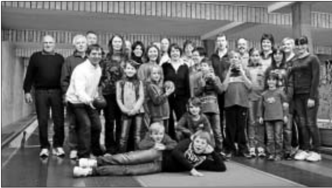
Neujahrskegeln 2011 in der Kimmichstubb

Das neue Jahr hat für den Liederkranz wieder sportlich begonnen. Beim Neujahrskegeln in der Kimmichstubb konnten sich Sänger aller Altersklassen messen.