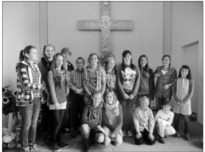
Konfirmandengruppe und Kinderkirche vor dem Erntedankaltar