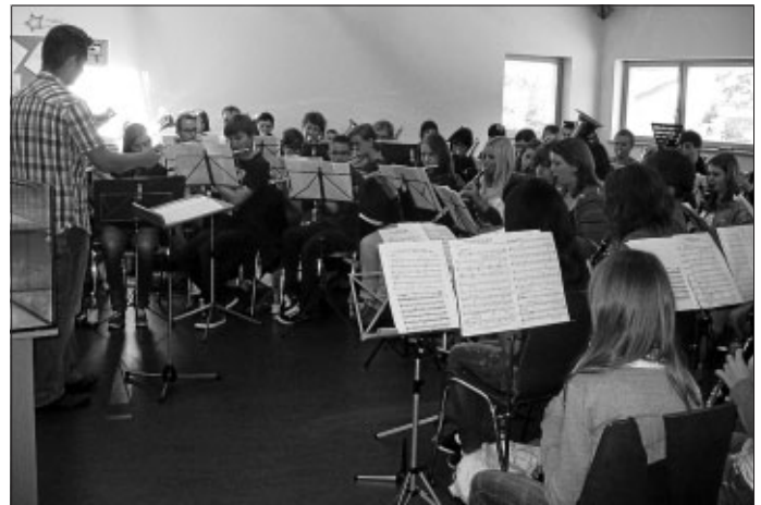
Fast 70 Jugendlichen bilden derzeit das Jugendkapellen-Projekt-Orchester.

Anfang Oktober fand die zweite Gemeinschaftsprobe der Jugendkapellen aus Stammheim, Gechingen und Merklingen diesmal im Probenraum des MV Gechingen statt. Im Hinblick auf ihren ersten Auftritt beim Stammheimer Interpretenkarussell am 5. November investierten die Jugendlichen einen ganzen Samstagnachmittag in die Probenarbeit.