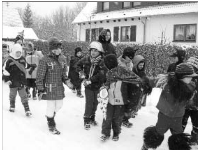
Grundschüler und Kindergartenkinder machen auch dieses Jahr den Wimberg wieder unsicher.

Auch dieses Jahr sind die jungen Narren wieder auf dem Wimberg unterwegs. Am Donnerstag, 3. März, ziehen die Kinder der Kindergärten Alzenberg und Wimberg zusammen mit den Grundschulern der Wimbergschule in einem Umzug durch die Straßen des Wimbergs. Lautstark unterstützt werden sie von der Bläserklasse 6. Jeder, der den Umzug anschauen und bejubeln möchte, sollte sich an der folgenden Strecke postieren: Start ist um 11 Uhr im Schulhof der Wimbergschule, dann geht es über den Fußweg zur Frauenwaldstraße, über Oberriedter Straße, Ostlandstraße, Schubartweg, Listweg, an der Bergkirche vorbei zur Frauenwaldstraße zurück zum Schulhof. Voraussichtliches Ende des Umzugs wird gegen 12 Uhr sein.