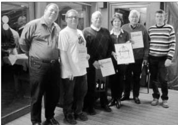
Das Bild zeigt die Geehrten zusammen mit dem 1. und dem 2. Vorsitzenden

Im Anschluss an den offiziellen Teil gab es noch ein gemütliches Beisammensein.