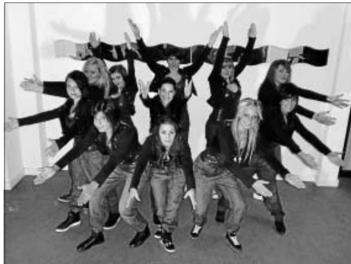
Gruppe Dalumble freut sich auf den Auftritt in Weilheim

Wir wünschen euch viel Glück und hoffen, dass der Wanderpokal wie bereits im Jahr 2009 wieder nach Altburg kommt.