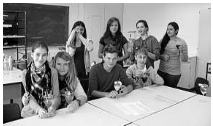
An den Projekttagen lernten die Schüler, wie man gesunde Cocktails mixt