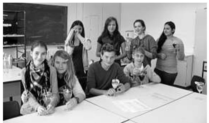
An den Projekttagen lernten die Schüler, wie man gesunde Cocktails mixt