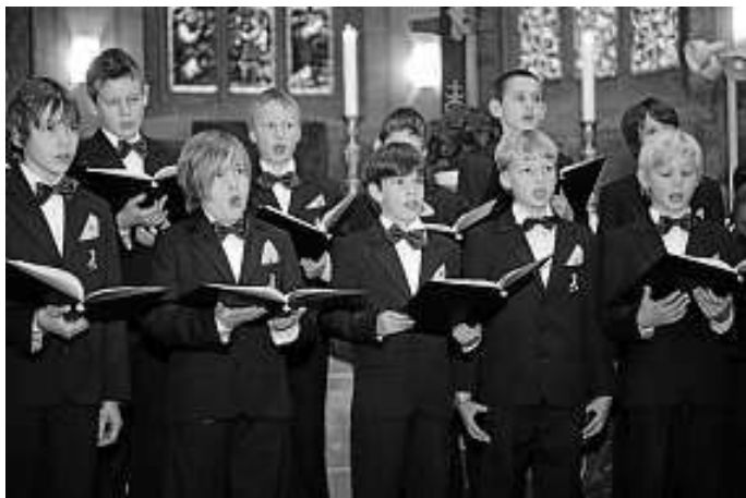
Aurelius Sängerknaben Calw