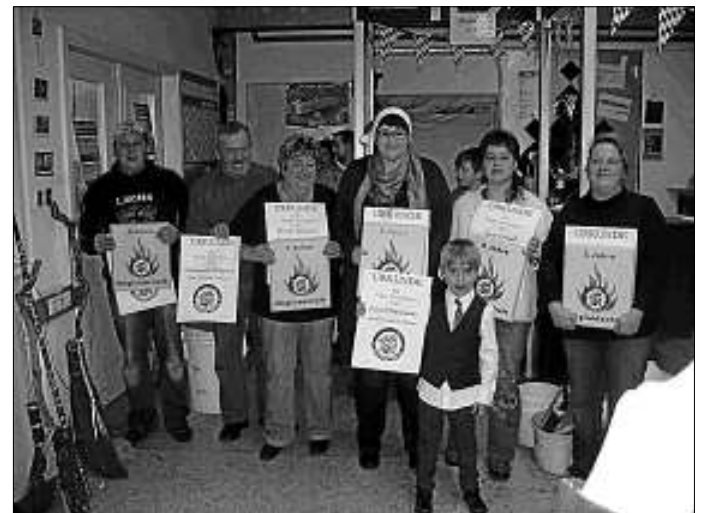
Rückblick: Ehrung für 5 Jahre Vereinstreue