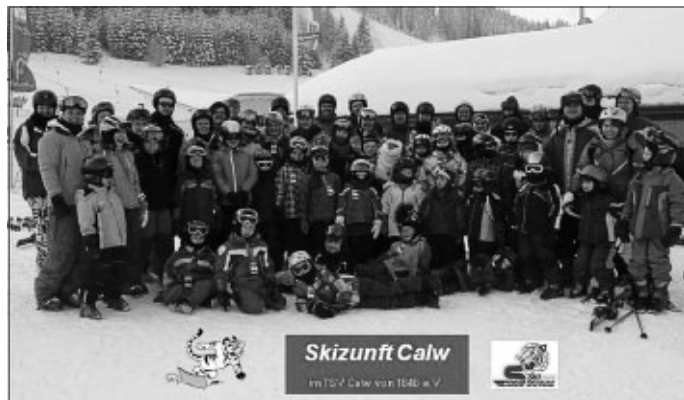
Eine der Gruppen in Jungholz