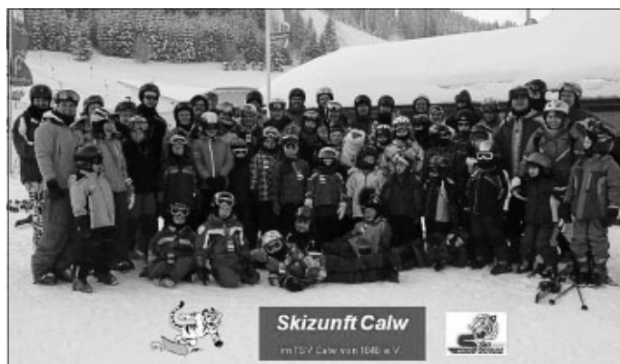
Eine der Gruppen in Jungholz