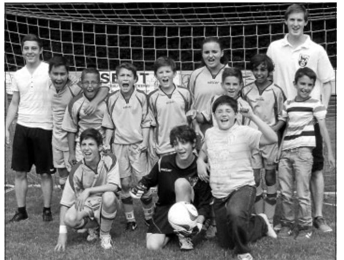
Meister der D-Junioren: FV Calw