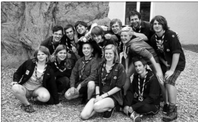
Teamgeist und super Stimmung herrschte bei den Pfadfindern während dem Wimberger Stadtfest