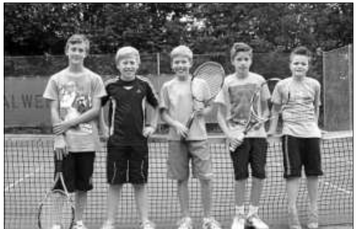
Unsere Aufsteiger : Knaben 1