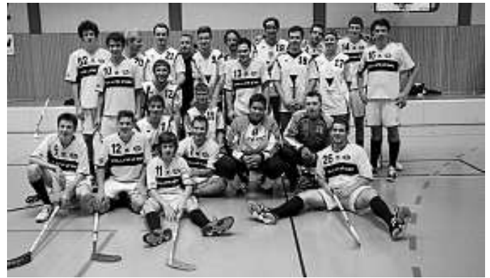
Nur auf dem Spielfeld Gegner – Die Freunde der TSV Calw Floorball-Lions und des UHC Collina d'Oro.