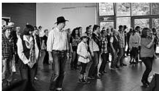
Workshop im Hirsauer Kursaal am 29. September

Am 10.11. beginnt in der Turnhalle der Wimbergschule unser 3. Herbstkurs. Er findet jeweils 6-mal von 11.00 bis 12.30 Uhr statt. Vermittelt werden Grundkenntnisse sowie einfache Beginnertänze. Anmeldung sowie weitere Infos ab sofort unter Tel. 07051 936022 oder per email wildbuffalodancer@googlemail.com möglich. Infos zur Gruppe und vieles mehr unter www.wildbuffalodancer.de.tl