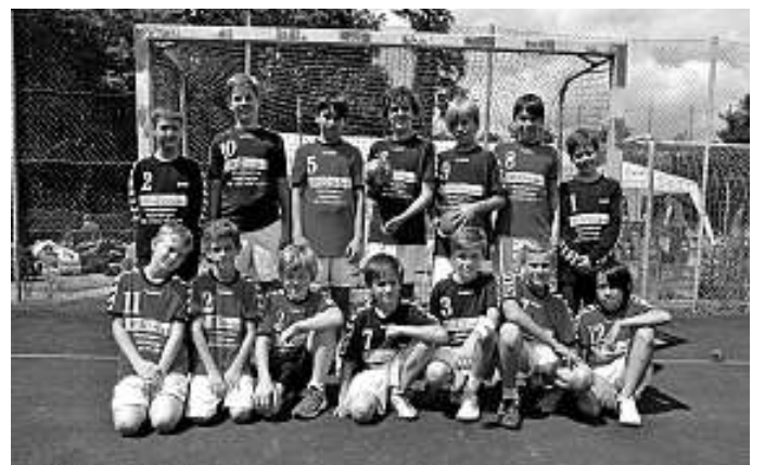
männliche D-Jugend 1+2 in der Saison 2012/2013