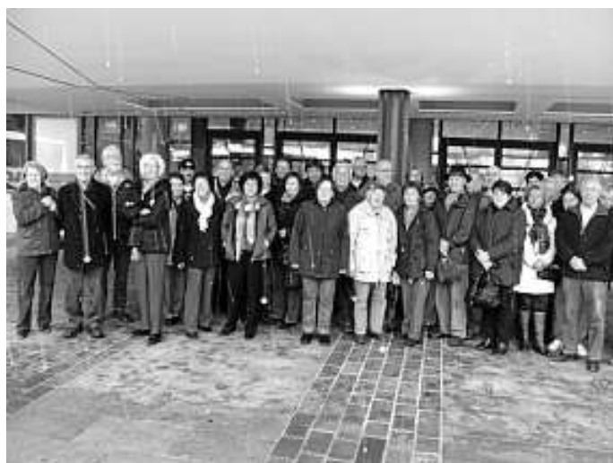
Ein Teil der Besucher aus Calw