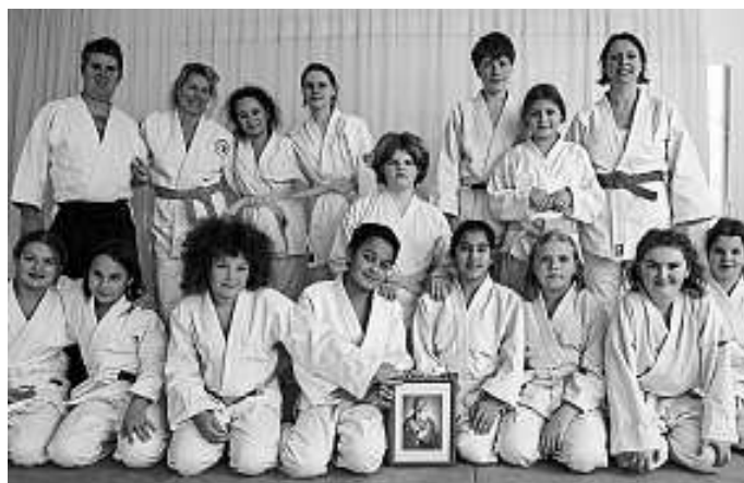
Stolze Kinder nach der Gürtelprüfung mit Prüfer und Trainerinnen