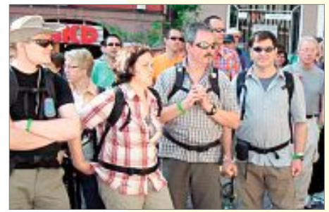
Pfingstturnier des TSV Hirsau