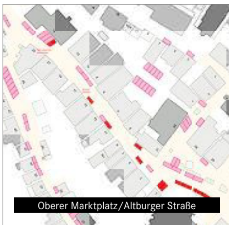
Oberer Marktplatz/Altburger Straße