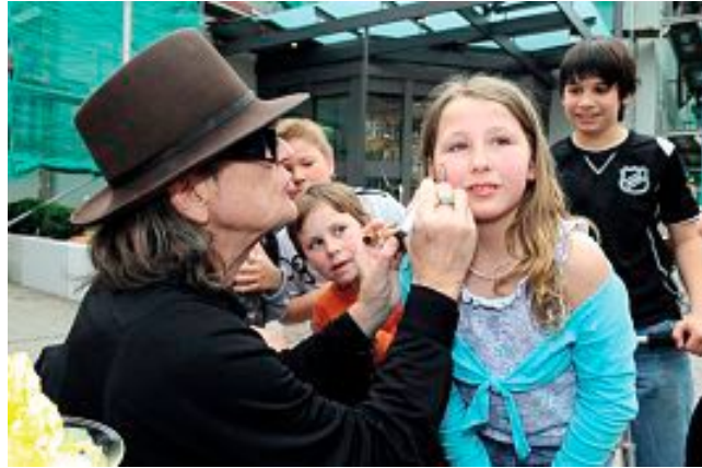
Wangenautogramm: Udo Lindenberg bei einem Besuch in Calw

Beim diesjährigen Wettbewerb ist die stilistische Bandbreite besonders hoch: Nicht nur Rock- und Popbands sowie Singer/Songwriter haben sich beworben, auch deutschsprachiger Reggae, Funk, Hip Hop, Elektro und