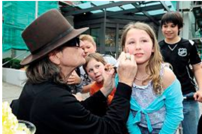
Wangenautogramm: Udo Lindenberg bei einem Besuch in Calw

Beim diesjährigen Wettbewerb ist die stilistische Bandbreite besonders hoch: Nicht nur Rock- und Popbands sowie Singer/Songwriter haben sich beworben, auch deutschsprachiger Reggae, Funk, Hip Hop, Elektro und