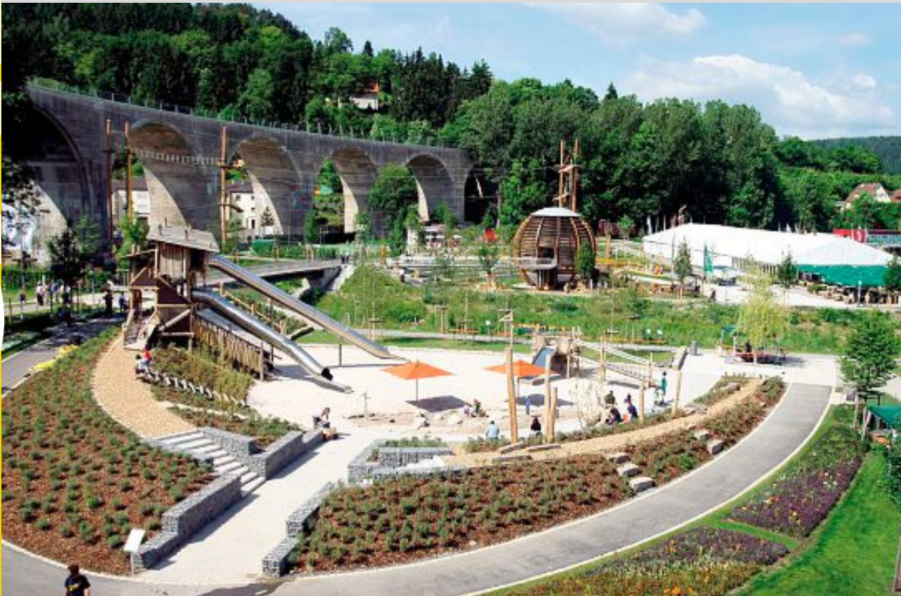
Blick auf den Riedbrunnenpark in Nagold, wo sich unter anderem der Landkreis-Pavillon befindet