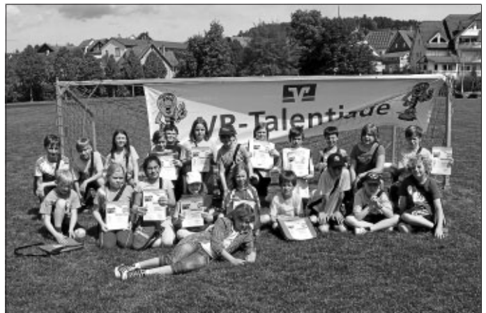
Das Siegerteam von der Wimbbergschule

Am Freitag, dem 11. Mai fand im Stammheimer Stadion bei schönstem Wetter die Leichtathletik-Talentiade der Volks- und Raiffeisenbanken statt. Daran nahmen 220 Viertklässler aus verschiedenen Grundschulen aus Calw und Umgebung teil. Das Besondere an diesem Wettkampf ist, dass nicht die Leistung von einzelnen Sportlern im Vordergrund steht, sondern die Gesamtleistung der jeweiligen Grundschulklasse zum Erfolg führt. So kämpften neun Klassen um den Titel der besten Klasse im Raum Calw. Dazu gab es folgende, leichtathletische Disziplinen: Werfen mit drei unterschiedlichen Wurfgegenständen, Zonen-Weitsprung in Reifen und 50-m-Sprint. Die schnellsten Läufer qualifizierten sich zudem für den Schlusslauf und traten dort gegen die Besten ihres Jahrganges aus den anderen teilnehmenden Klassen an.