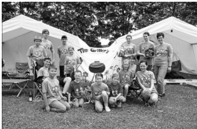
Die Altburger und Schömberger Zeltlagerteilnehmer

Am Pfingstamstag fahren zwei Jugendliche der Trachtengruppe Altburg zusammen mit den Schömbergern nach Flözlingen zum alljährlichen Zeltlager des Trachtengaus. Nachdem jeder sein Zelt bezogen hatte, gab es eine kleine Begrüßung, danach ging es weiter mit verschiedenen Spielen auf dem Zeltplatz. Nachdem alle gegessen hatten gestalteten ein paar Vereine ein Abendprogramm. Anschließend gab es noch bunte Musik zum Tanzen. Am nächsten Tag nach dem Frühstück wurde ein Markt der Möglichkeiten geboten. Da gab es verschiedene Bereiche aus dem sich jeder etwas raussuchen durfte z.B. Floße bauen, Geschichten erzählen usw.. Nachmittags wurden dann wie immer die Spiele um