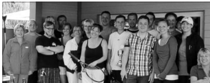
Wie viele Teilnehmer werden es dieses Jahr sein?

Wer wird dieses Mal den Pokal mit nach Hause nehmen? Sind es die Sieger vom Vorjahr oder vielleicht eine ganz neue Mannschaft? Diese spannende Frage können wir in gut 3 Wochen auflösen... denn am 30.6. - um 14 Uhr - wird der Startschuss für die Spiele gegeben. Das 2-Tages-Turnier ist ein Mannschaftswettbewerb und teilnahmeberechtigt sind Mannschaften von Vereinen, Firmen, Stammtischen, Freundeskreisen oder Familien, die in Holzbronn und Umgebung ansässig und keine aktiven Mitglieder eines Tennisvereines sind. Es wird Tennis in Kombination mit Boule gespielt. Tennisschläger, -bälle und Boulekugeln stellt der Verein; Tennisschuhe bzw. Schuhe mit wenig Profil sollten mitgebracht werden. Die Startgebühr pro Mannschaft beträgt 10 EUR und Anmeldungen nehmen die Tennisfreunde gerne bis 24.6. entgegen. Trainingsmöglichkeiten für die teilnehmenden Mannschaften bieten wir vom 25. - 29.6 (jeweils ab 18 Uhr) auf der Tennisanlage bzw. dem Bouleplatz an. Nach einem kämpferischen Turniertag folgt ein gemütlicher Samstagabend, der musikalisch von DJ Dennis umrahmt wird. Auch Besucher sind herzlich willkommen.