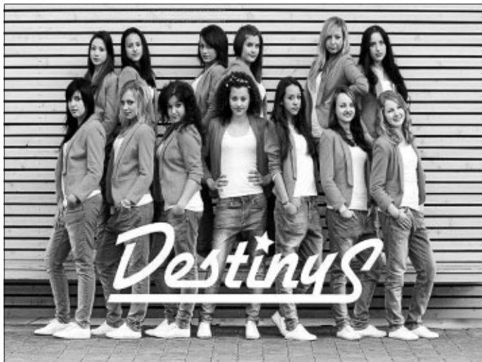
Die Süddeutschen Vize-Meister werden als "Sportler der Region" bei der Landesgartenschau in Nagold auftreten

Am Sonntag, den 10. Juni geht es dann bei der Landesgartenschau weiter. Beim "Bad Liebenzeller Tag" werden die Gruppen BUBBLES, Jelly Bellys und DestinyS* gegen Nachmittag ihre Tänze vorführen.