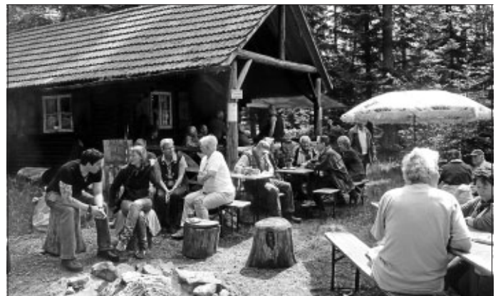
Das traditionelle Grillfest an Fronleichnam bot sich an um dieses Ereignis 50 Jahre nach der Gründung am 7. April 1962 gebührend zu feiern.