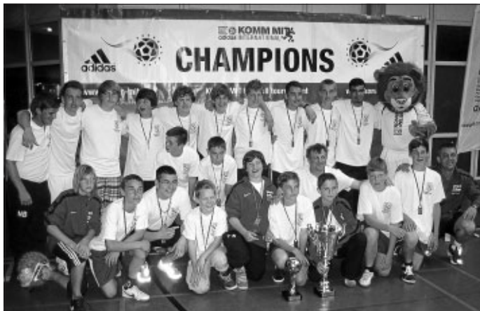
Nochmals Glückwunsch an unsere C-Jugend zu diesem tollen Erfolg und einen herzlichen Dank an alle, die unsere Jugend unterstützt haben.

derlage gegen den Gastgeberverein, den Nachwuchs einer belgischen Zweitligamannschaft einstecken. Nach einem weiteren Sieg zogen wir als Gruppenerster ins Finale ein, das wir verdient im Elfmeterschießen gegen die Mannschaft aus Leipzig gewannen. Bei der Siegerehrung bekamen wir außer dem großen Pokal für den 1. Platz auch noch den Fair Play Pokal aller Altersklassen die am Turnier teilnahmen. Nach dieser großartigen Leistung wurden die Pokale mit einem Grillpaket der Metzgerei Mann ausgiebig gefeiert.