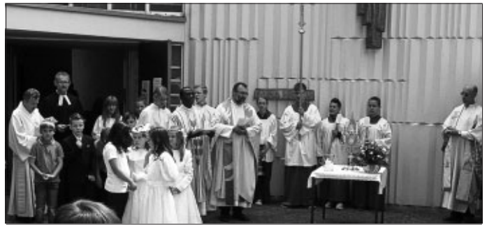
Fronleichnam am 7. Juni - Gottesdienst und Prozession anschließend Gemeindefest. Herzlichen Dank allen, die zum guten Gelingen beigetragen haben.

21 Uhr Johannisfeuer auf dem Galgenberg ( siehe kath Kirche Kernstadt )