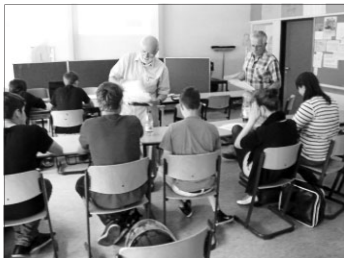
Die Neuntklässler konnten bei einem Test herausfinden: Welcher Konsumtyp bin ich?