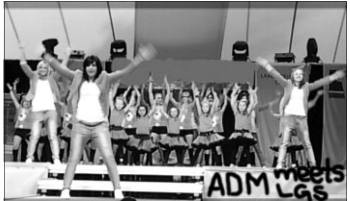
Bühne frei! - "ADM meets Landesgartenschau"

Am vergangenen Freitag, 8. Juni ging es hoch her in Nagold. Auf der Landesgartenschau wurde zur "Nacht des Sports" geladen und da durfte der ADM natürlich nicht fehlen. Die Lil' SweetS, SNEAKY!, die DestinyS* und die Solo- und Duo- Tänzerinnen gestalteten zusammen mit Turnern aus Straubenhardt, Kunstradfahrern aus Heidenheim und vielen weiteren einen bunten Abend und boten dem Publikum eine Abwechslung zur Ehrung der Sportlerin, des Sportlers und der Mannschaft des Jahres und zu einer politischen Debatte zum Thema "Sport".