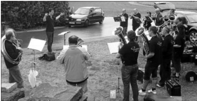
Das war "Brass uff d'r Gass" am 31. Mai. Toll, dass trotz des Regenwetters viele Zuhörer da waren.