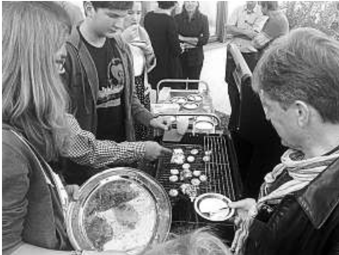
Zum Anlass des Erntedankfestes grillte der Jugendkreis für die ganze Gemeinde gefüllte Pilze mit Schafskäse.