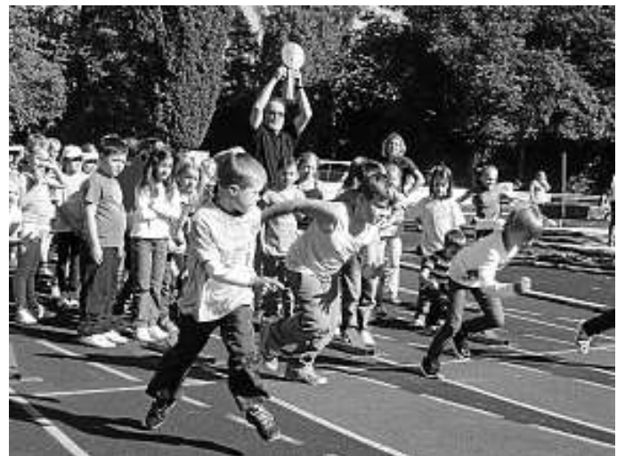
Spannung und Dynamik bei den Wettkämpfen

Als schließlich kurz vor 13 Uhr die Bundesjugendspiele zu Ende gingen, konnten sich auch einige Neuntklässler über Sieger- oder sogar Ehrenurkunden freuen.