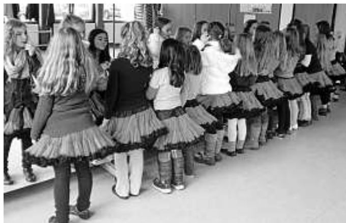
Die Lil' SweetS treffen die letzten Vorbereitungen: Schminken und Stylen

Unsere „Kleinen“ wollen es morgen, am 17. November wissen: Die LIL SWEETS vom ADM fahren zur Deutschen Meisterschaft vom IVM nach Ludwigshafen, um sich mit Formationen aus ganz Deutschland zu messen.