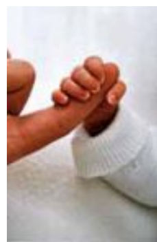
Mit Kraft ins Leben - Kliniken Calw

Die geburtshilfliche Abteilung der Kliniken Calw lädt werdende Eltern am Donnerstag, den 13. Juni um 19.30 Uhr zu einem Informationsabend im Gemeinschaftsraum ein. Themen sind u. a. Schwangerschaft, Geburtsvorbereitung, Geburt, Wochenbett, Stillen, Neugeborenenpflege und Nachbetreuung. Zur Sprache werden auch alternative Methoden wie Homöopathie und Aromatherapie kommen. Als Gesprächspartner stehen Hebammen, Kinderkrankenschwestern und Ärzte der Geburtshilfe zur Verfügung. Neben den allgemeinen Informationen werden auch die Angebote der Wochenstation, des Kreißaals und des Kinderzimmers vorgestellt. Geplant ist zudem eine Besichtigung des Kreißaals.