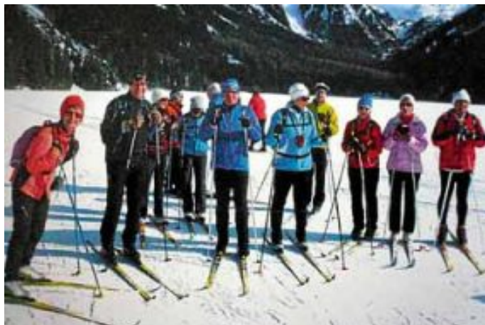
Langläufer der Skizunft Calw im Höllesteintal

Während im Nachbarhotel die Deutsche Nationalmannschaft zur Vorbereitung auf die WM untergebracht war genossen die Nordischen der Skizunft Calw auf den hervorragend präparierten Loipen mit ihren Skiern unterwegs zu sein. An fünf Tagen trafen sie beste Schneeverhältnisse an, dabei auch noch bei tollem Sonnenschein.