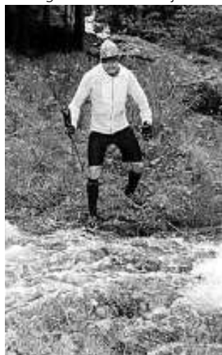
Bachquerung nach 35 km