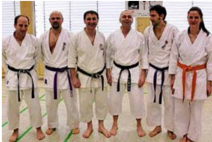
G. Torzi mit Mitgliedern des Vereins

Weitere Informationen erhalten Sie unter www.skd-calw.de