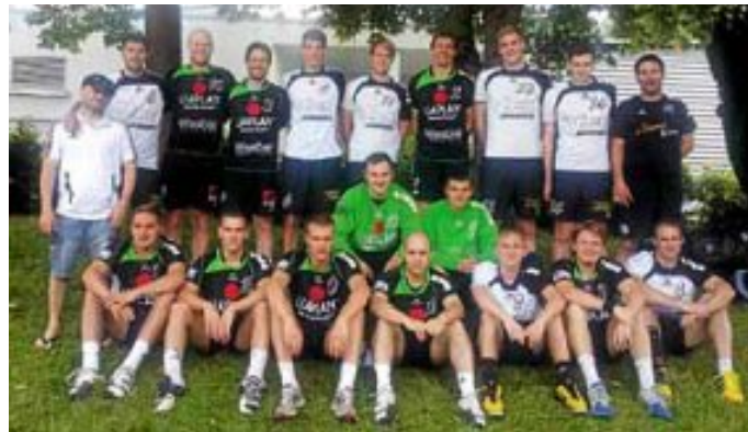
Männer 1 und 2 beim Turnier in Wössingen

Auch einige Jugendmannschaften spielten in Wössingen, da gibt es nächste Woche die Berichte.