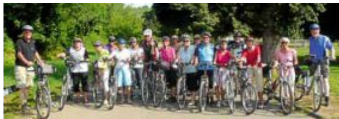
Die Radgruppe in Kirchheim am Neckar

trasse, dem so genannten Entenmörder, leicht aufwärts ging. Nach Talheim, Ilsfeld und Beilstein mussten sich die Radler dann anstrengen um auf den Wunnenstein zu kommen. Über Pfahlhof und Neckarwestheim war Lauffen bald wieder erreicht - immer leicht abwärts zur Erholung. Die etwas südlicher gelegene Stadt Kirchheim wurde als Ausgangspunkt für den nächsten Tag gewählt. Erst am Neckartalradweg aufwärts, dann am Enztalradweg entlang ging es gemütlich bis Bietigheim. Die herrlichen Weinbergwege um Besigheim, dem schönsten Weinort Deutschlands, ließen die Herzen der Radler höher schlagen. Zweimal wurde der Neckar überquert und es ging über Mundelsheim, Hessigheim und Gemrigheim, vorbei an Weizen- und Maisfeldern, zurück zum Parkplatz in Kirchheim am Neckar. Die Teilnehmer der Radlergruppe der Skizunft hatten etwa zur Hälfte E-Bikes dabei. Die Disziplin war außerordentlich gut und man konnte die lange Schlange hintereinander fahrender Radler nur bewundern.