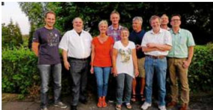
Neuer Vorstand bei C.A.L.W.