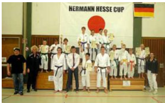
Erfolgreichstes Dojo auf dem Hermann-Hesse-Cup