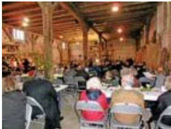
Erntedankgottesdienst am 12. Oktober, mit der Gemeinde Böblingen in der Hofkapelle vom Hofgut Mauren.

Tag des Geistes der Weissagung. Gottesdienst: Abendmahl 9.30 Uhr Bibelgespräch Thema: Die Opfer – sinnvolle Rituale. 9.30 Uhr Kindergottesdienst, verschiedene Altersgruppen. 10.30 Uhr Predigt: V. Ott Sammlung: Für den Kapellenbau Ost. Zum Gottesdienst und den Veranstaltungen sind Gäste herzlich willkommen.