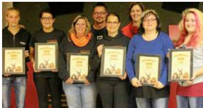
Für 5- und 10-jährige Mitgliedschaft wurde geehrt.