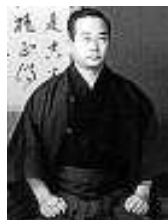
Nakayama Masatoshi (1913-1987)

Nähere Informationen über Karate und unsere Trainingszeiten finden Sie auf unserer Homepage www.skd-calw.de