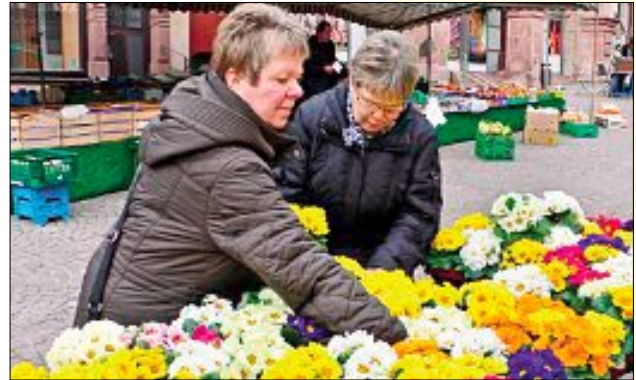
An solch fröhlichen Farben kann man nicht vorübergehen

Frühlingsblumen, frisches Gemüse, knackiges Obst und noch vieles mehr: Beim Frühjahrsopening des Calwer Wochenmarkts (jeden Samstag von 8 bis 13 Uhr) kamen die Besucher wieder in den Genuss bester Qualität und füllten ihre Einkaufskörbe. Außerdem konnte das erste „Calwer Marktrezeptbuch“ erworben werden, das Rezepte mit regionalen Produkten vom Wochenmarkt enthält. Das Marktrezeptbuch ist auch ideal als Geschenk geeignet und kann ab sofort jedes Wochenende bei den Markthändlern erworben werden. Sehr zur Freude der Kinder waren die Kleintierzüchter Stammheim mit weißen Osterhäschen auf dem Marktplatz. Für den musikalischen Rahmen sorgte auf dem Marktplatz das Duo „Natural Groove“.