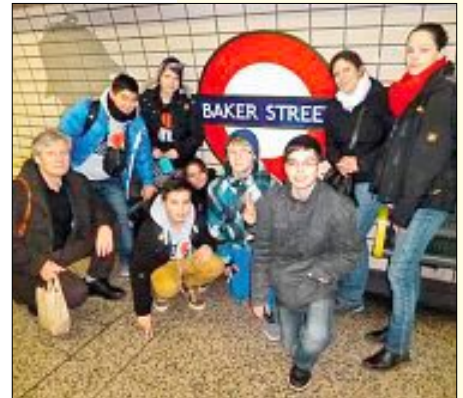
Die Schüler aus Heumaden in London, der Heimatstadt von Sherlock Holmes

Und auch jetzt, nach der Reise, scheint die Heu-