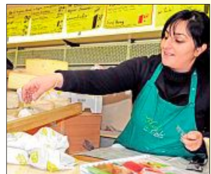
Der leckere Käsegeruch und der Sortenreichtum lockte zahlreiche Kunden an