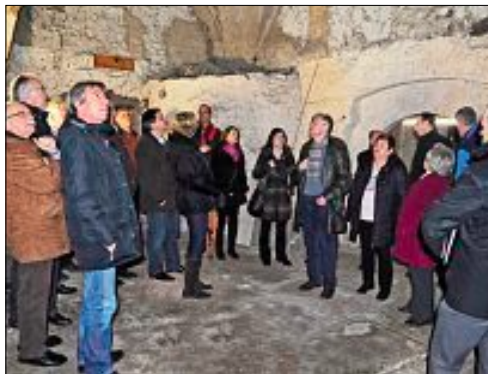
Der Calwer Gemeinderat besichtigte das Steinhaus