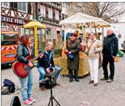
Für die passende musikalische Unterhaltung auf dem Marktplatz war gesorgt