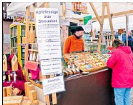
Bummeln, stöbern und probieren – auf dem Calwer Wochenmarkt macht das richtig Spaß