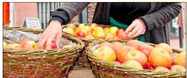
Frische Produkte zeichnen den Calwer Wochenmarkt aus