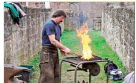
Historisches Handwerk lebte wieder auf

Am Sonntag verbrachten viele Besucher einen schönen Tag in Hirsau. Als Angebot zum Nordschwarzwaldtag war dort einiges geboten. Neben den Klöstern St. Peter und Paul und St. Aurelius standen vor allem weitgehend unbekanntere Ecken im Mittelpunkt, ergänzt von einigen Aktionen, die speziell für diesen Tag organisiert wurden. So standen Führungen durch die Klöster, musikalische Darbietungen in der Aureliuskirche und ein Informationsstand zur Hesse-Bahn zur Auswahl. Auch konnte man an einigen Stellen Handwerker und Künstler bei der Arbeit beobachten oder den Kräuterduft im Klostergarten genießen.