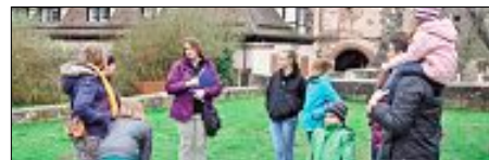
Ein schöner Tag für die ganze Familie