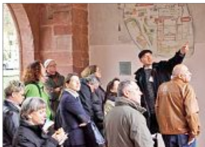
... und viele Informationen für die Besucher