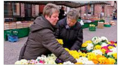
An solch fröhlichen Farben kann man nicht einfach vorbeigehen

Ein ganz besonderes Angebot ist, dass die gekauften Pflanzen in mitgebrachte Blumenkübel von den Gärtnern gleich noch fachgerecht und kostenlos eingepflanzt werden. Damit sich jedoch mit den schweren Blumenkübeln niemand abschleppen muss, stehen die freundlichen Marktträger sehr gerne allen Marktbesuchern zur Seite. Auch außergewöhnliche Container-Rosen sind neu im Angebot. Und während die Gärtner fleißig einpflanzen, steht an vielen Ständen das „edle Gemüse“, der Spargel, im Mittelpunkt. Die Markthändler präsentieren ein großes Angebot, dazu gibt es viele Rezepte rund um den Spargel. Und als Highlight ist der Koch Klub Nordschwarzwald der DEHOGA zu Gast in Calw. Die Profis schälen auf dem Marktplatz Spargel, was die Schäler hergeben, kredenzen Leckeres rund um den Spargel und geben gerne viele Tipps für die gute Küche zu Hause.