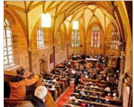
Klingendes Kloster in der Marienkapelle