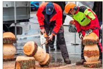
Das Passende für Naturburschen