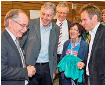
Lokalprominenz bei Top Job