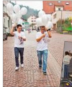
Kleine Souvenirs in Form von Luftballons gab es am Samstag auch