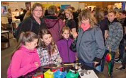
Ob das Handwerkliche uns liegen würde?