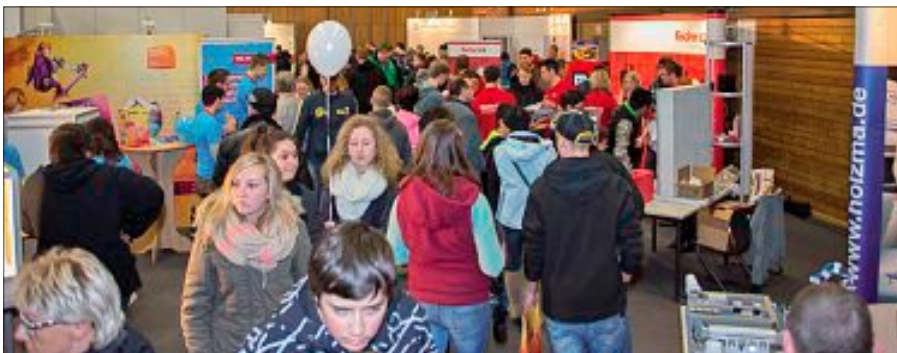
Zahlreiche Jugendliche nahmen die Chance wahr, in die Berufswelt hineinzuschnuppern