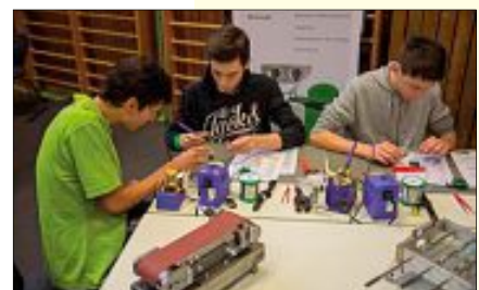
Anfassen, Ausprobieren, Testen