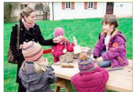
Auch die Kinder kamen auf ihre Kosten