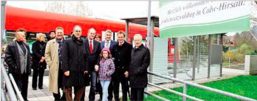
Herzlich willkommen beim Nordschwarzwaldtag in Hirsau